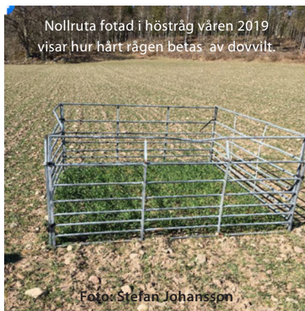
Nollruta fotad i höstråg våren 2019 visar hur hårt rågen betas av dovsvilt.

Efter älgboomen och rådjursexplosionen då jägarkåren växte markant kom jägarkåren att minska från det sena 1990-talet och framåt. Det senaste halvdussinet år har jägarkåren åter ökat, mycket beroende på ett intresse för ekologiskt och lokalt framställt kött. Fenomenet med jaktens ökade popularitet går hand i hand med gårdsbutiker, Bondens marknad, REKO-ringar etc. Under samma period har även viltstammarna förändrats. Rådjuren har minskat och älgstammen är lokalt nere på tidiga 1970-talsnivåer. Andra djur ökar. Dovviltet sprider sig och är i södra Sverige vanligare än älgar. Men allra bäst har det gått för vildsvinen som finns i fasta stammar i hela Götaland och stora delar av Svealand.