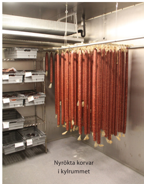
Nyrökta korvar i kylrummet