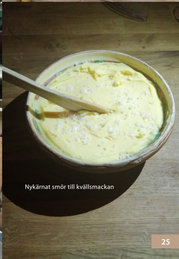
Nykärnat smör till kvällsmackan