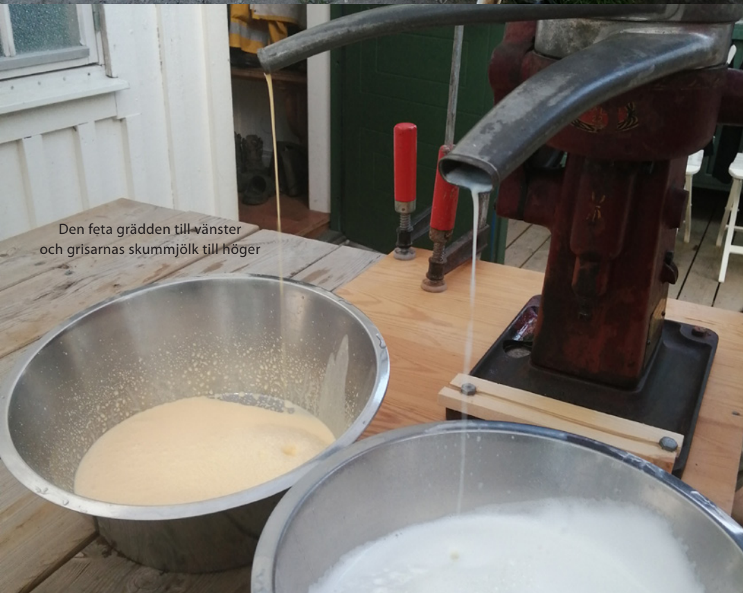
Den feta grädden till vänster och grisarnas skummjolk till höger